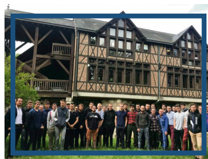
Maison des Compagnons de Mont-Saint-Aignan

Pour plus d'informations : https://www.compagnons-du-devoir.com/regions/normandie